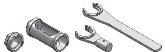
Spannschlüsselausführungen Wrench types

Denkfabrik Sauter: Mit uns dreht die Welt! Sauter innovation factory: Mit uns dreht die Welt!